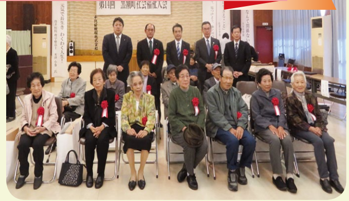
◎90歳いきいき長寿表彰 42名