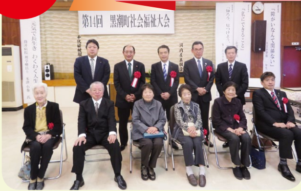
◎黒潮町長表彰（模範高齢者）5名 ◎黒潮町社協会長表彰（優良介護者）1名