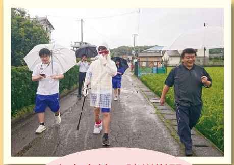
大方高校の防災学習 「逃げトレ」で高齢者と 車いす使用者の視点で 避難訓練