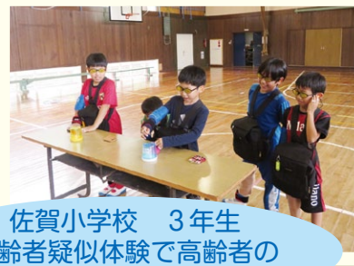
佐賀小学校 3年生 高齢者疑似体験で高齢者の 気持ちを勉強中