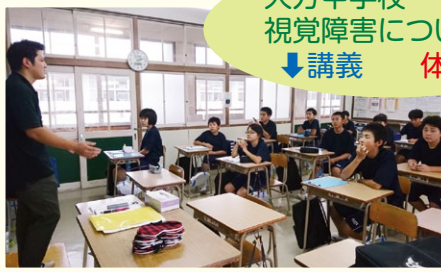
大方中学校 1年生 視覚障害についての ↓講義 体験→

町内の小学校や中学校、高校などで福祉体験を行いました。 体験を通して、相手への心遣いや思いやりの気持ち、当事者の気持ちを感じとってくれたと思います。